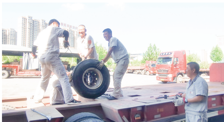
在第95个“八一”建军节来临之际,包储分公司退伍军人和“两参”人员开展“我是党员我带头活动”。

此次迎“新”志愿服务活动,是集团团委为新入职员工全力打造的“护航行动”系列活动的首发站,体现了公司青年职工爱岗奉献、积极向上的精神面貌,为新入职员工树立了良好的表率作用,营造出公司尊重人才、重视人才的良好氛围,助力新入职员工开启事业新征程。(程霄澎)